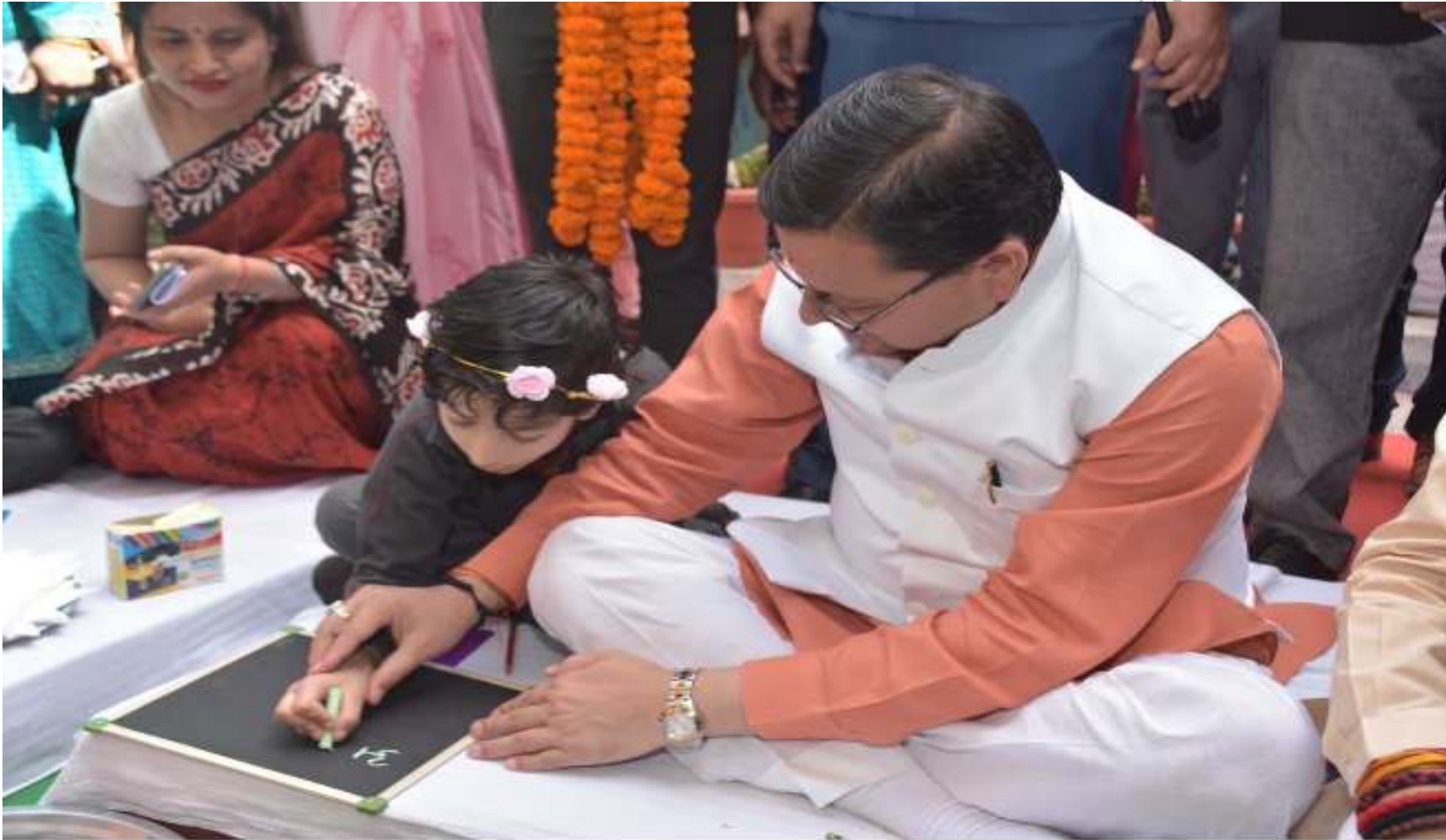
नेताजी सुभाष चन्द्र बोस आवासीय विद्यालय बनियावाला, देहरादून में शिक्षा विभाग द्वारा आयोजित 'प्रवेशोत्सव' कार्यक्रम के अवसर पर मुख्यमंत्री श्री मुष्कर सिंह धामी। दिनांक 11 अप्रैल, 2023