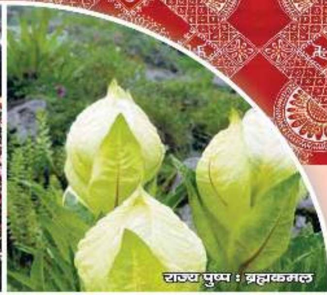
राज्य पुष्प : ब्रह्मकमल