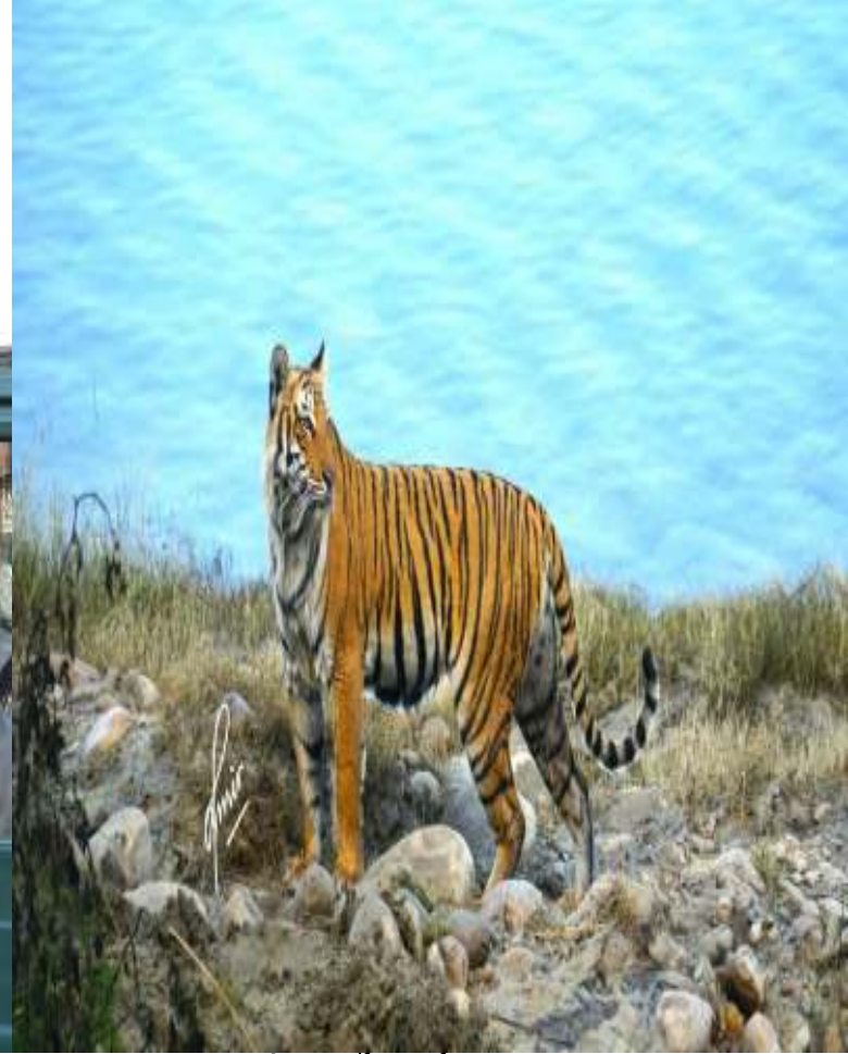
जिम कार्बेट पार्क