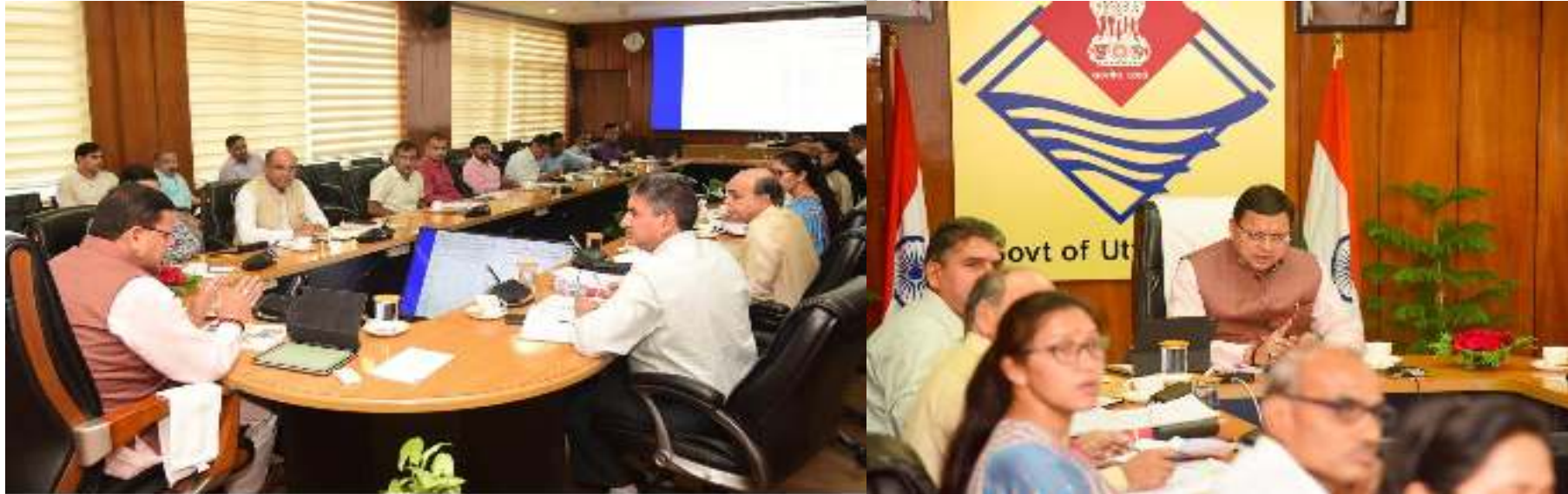
कार्यक्रम क्रियान्वयन विभाग की पहली समीक्षा बैठक जहां इस पुस्तकमें भी सुझाव दिए गये।

“इस पुस्तक को प्रकाशित करने का मुख्य उद्देश्य, पात्र लाभार्थियों को जनकल्याणकारी, स्वरोजगार/रोजगारपरक, कौशल विकास/प्रशिक्षणपरक, निवेशपरक योजनाओं का लाभ पहुंचाने की प्रक्रिया को सरल शब्दों में अवगत कराना है, जिससे पात्र लाभार्थी योजनाओं का लाभ प्राप्त कर सकें और हमारा उत्तराखण्ड “सर्वश्रेष्ठ उत्तराखण्ड” बन सके।” प्रथम बार, इस प्रकार की पुस्तक बनाने का समग्र प्रयास किया गया है। यह पुस्तक जहां पात्र लाभार्थी को योजनाओं का लाभ प्राप्त करने में सहयोग करेगी वहीं नीतिनिर्धारणकर्ताओं, शोधकर्ताओं, पाठकों के लिए रूचिकर एवं सरकार द्वारा किये जा रहे प्रयासों के प्रति सजग बनायेगी। इस पुस्तक में संशोधन/सुधार/सुझाव/आपत्ति हेतु कृपया निम्न पते/ईमेल में प्रेषित करना चाहें ताकि आगामी संस्करण को सुधारों के साथ प्रस्तुत किया जा सके।”