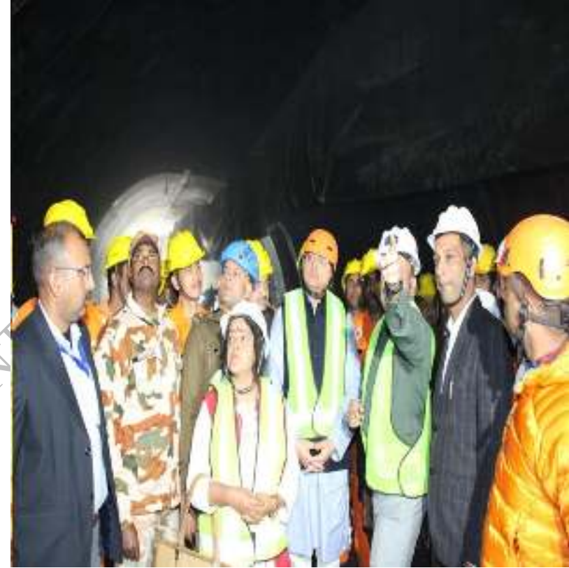
सिलक्यारा, उत्तरकाशी सुरंग में फंसे मजदूरों की जानकारी लेते हुए मा0 मुख्यमंत्री, उत्तराखण्ड