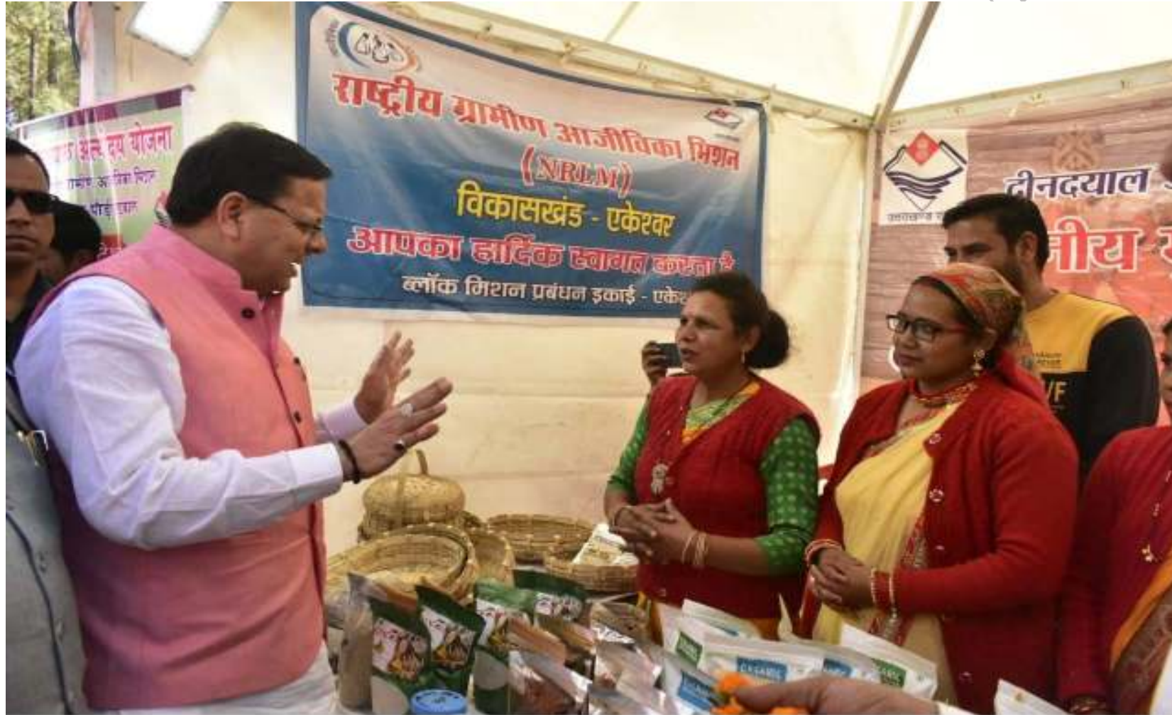
चौबट्टाखाल में आयोजित कार्यक्रम में विभिन्न विभागों द्वारा लगाये गये स्टॉलों का अवलोकन करते हुए मुख्यमंत्री श्री पुष्कर सिंह धामी । दिनांक 07 अप्रैल, 2023