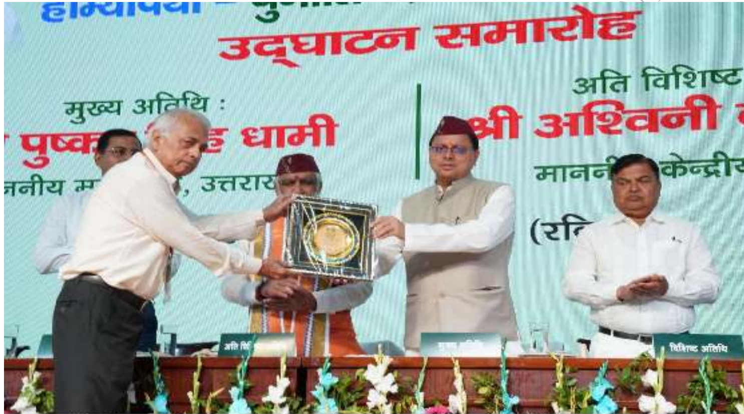
दून विश्वविद्यालय, देहरादून में राष्ट्रीय होम्योपैथिक सम्मेलन 'होम्योकॉन- 2023' के शुभारम्भ अवसर पर मुख्यमंत्री श्री पुष्कर सिंह धामी। दिनांक 14 मई, 2023