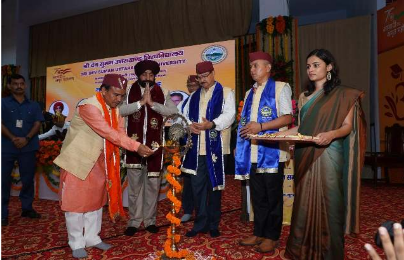
श्रीदेव सुमन उत्तराखण्ड विश्वविद्यालय का दीक्षांत समारोह कार्यक्रम।