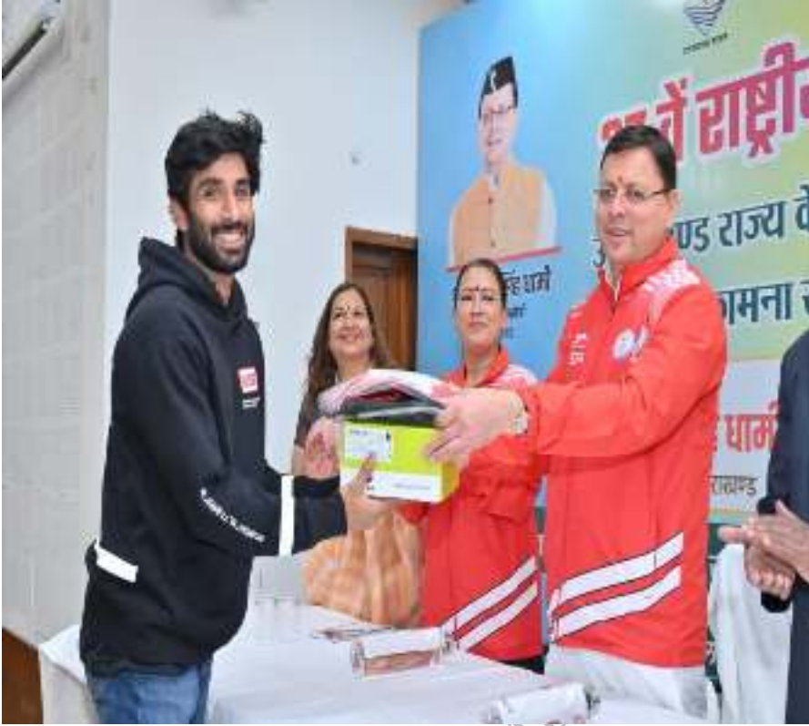
37वें गोवा राष्ट्रीय खेलों में हिस्सा लेने जा रहे खिलाड़ियों को खेल किट प्रदान करते हुए मा10 मुख्यमंत्री, उत्तराखण्ड