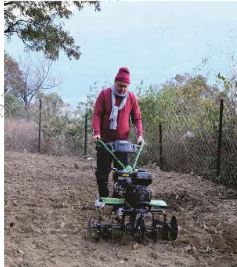
जनपद टिहरी में मा0 मुख्यमंत्री जी पॉवर वीडर (आधुनिक कृषि यंत्र) के माध्यम से खेत की जुताई करते हुए