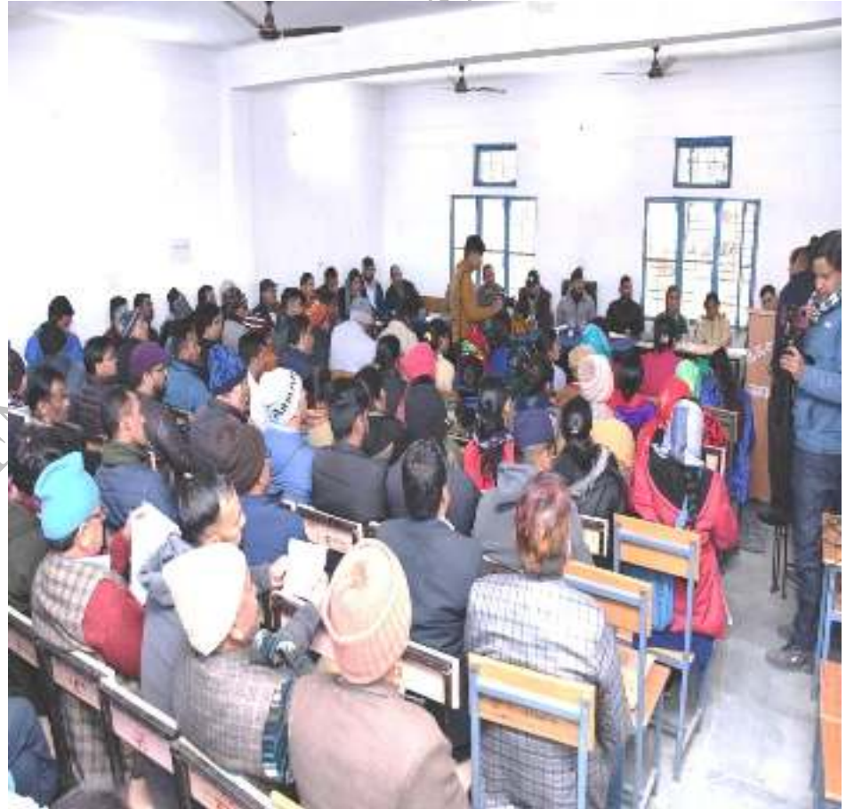
सुदूर क्षेत्र विकास खण्ड देवाल के घेस ग्राम पंचायत में बीडीसी की बैठक का आयोजन