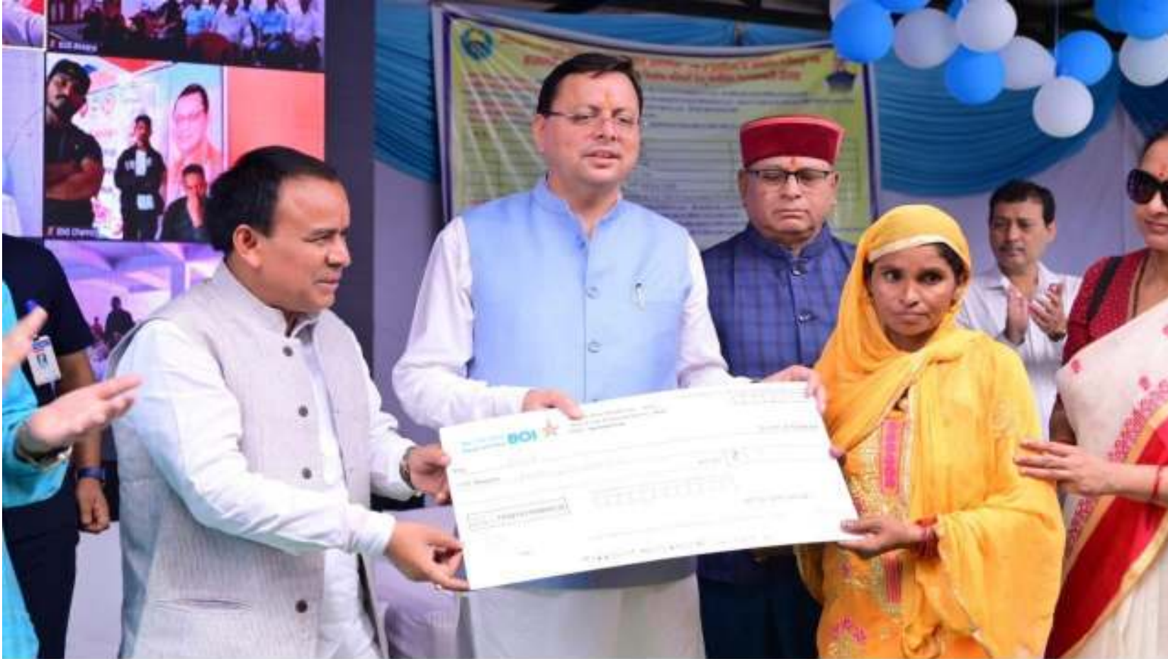
मुख्यमंत्री श्री पुष्कर सिंह धामी ने राजकीय बालिका इण्टर कॉलेज राजपुर रोड, देहरादून में श्रमिकों की पुत्रियों का विवाह उपरांत आर्थिक सहायता के चेक प्रदान किये। दिनांक 16 सितंबर 2023