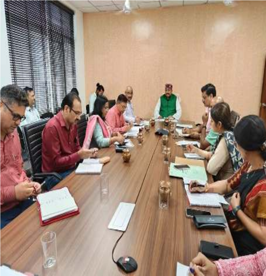
दिनांक 22 अगस्त 23 को पंचायतीराज विभाग की समीक्षा बैठक ।