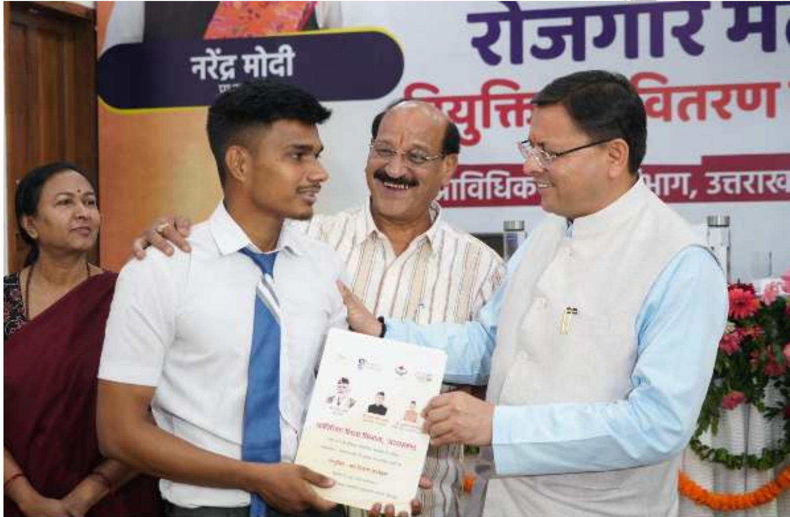
प्राविधिक शिक्षा विभाग द्वारा आयोजित कार्यक्रम में अभ्यर्थियों को नियुक्ति पत्र प्रदान करते हुए मुख्यमंत्री श्री पुष्कर सिंह धामी । दिनांक 05 जून, 2023