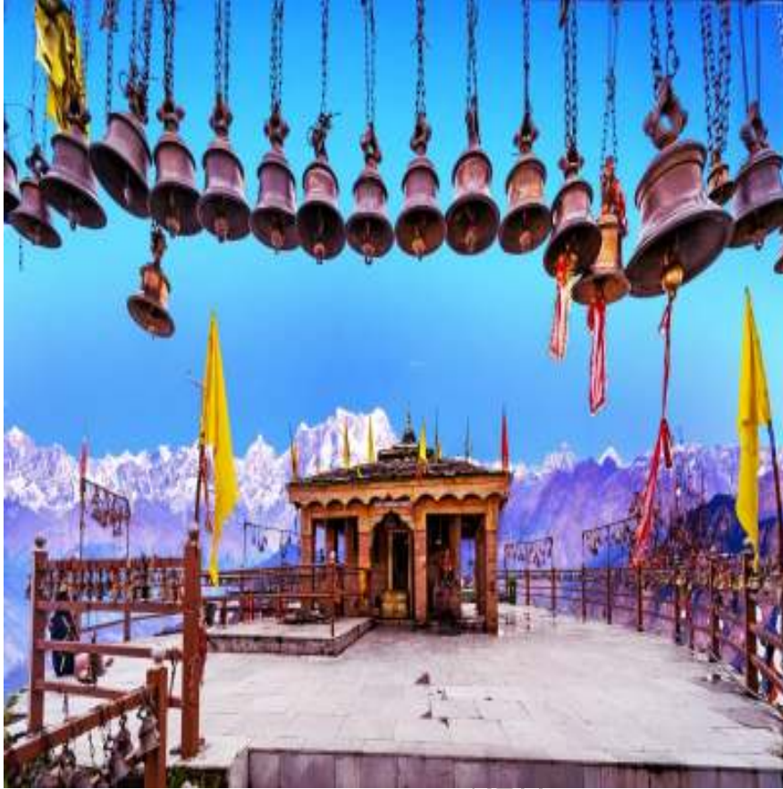
कार्तिक स्वामी मंदिर, जनपद—रुद्रप्रयाग