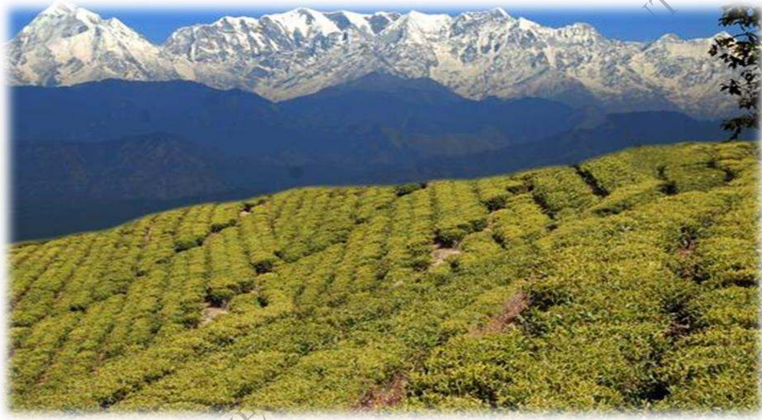
चाय बागान कौशानी, बागेश्वर