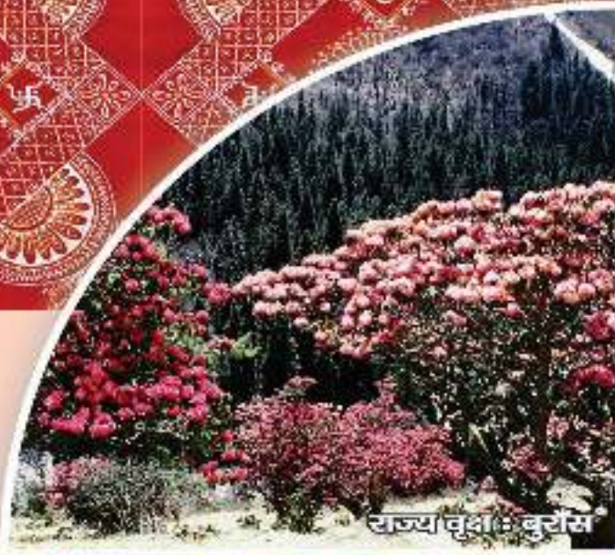
राज्य वृक्ष : कुसुम