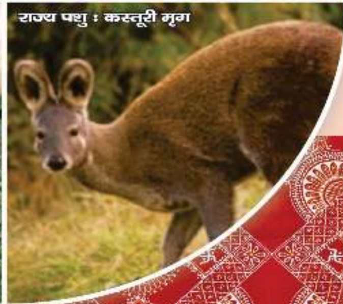
राज्य पशु : कस्तूरी मृग