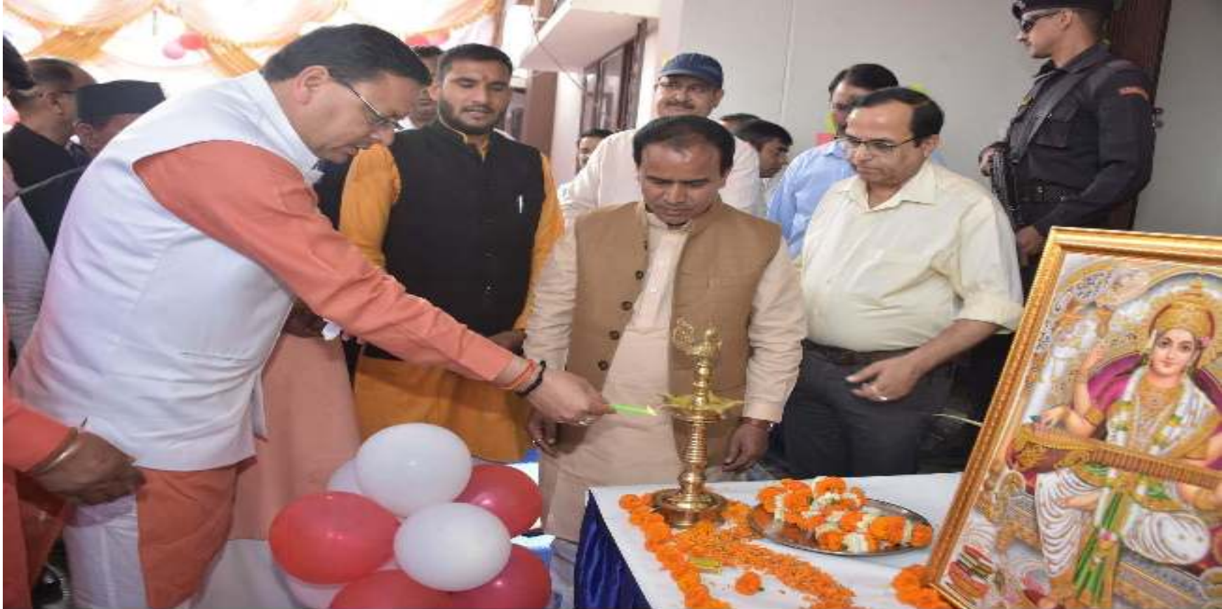
नेताजी सुभाष चन्द्र बोस आगारीय विद्यालय मनियावाला, देहरादून में शिक्षा विभाग द्वारा आयोजित 'प्रवेशोत्सव' कार्यक्रम का दीप प्रज्वलित कर कार्यक्रम का शुभारम्भ करते हुए मुख्यमंत्री श्री पुष्कर सिंह धामी । दिनांक 11 अप्रैल, 2023