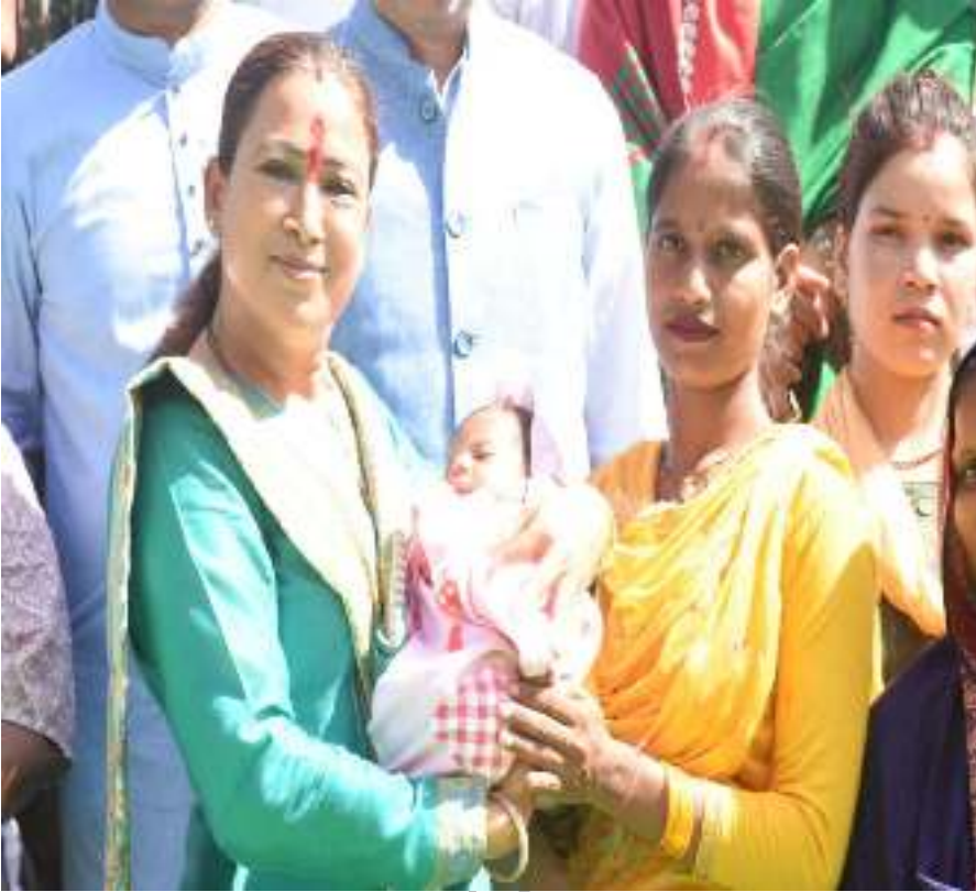
जनपद नैनीताल के रामनगर में गोदभराई कार्यक्रम में मा0 मंत्री जी