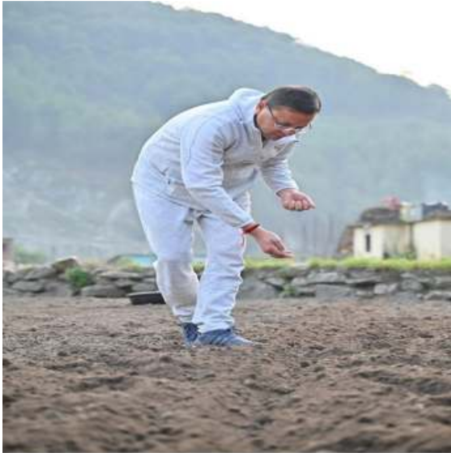
राज्य क्षेत्र में मंडूवे की खेती को बढ़ावा देने के मकसद से चाम शिरोर में 'लाइन रोइंग' विधि से मंडुआ की बोआई करते हुए मुख्यमंत्री श्री पुष्कर सिंह धामी। दिनांक 11 जून, 2023