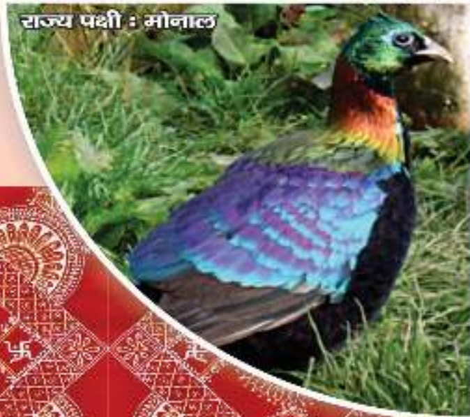
राज्य पक्षी : मोनाल