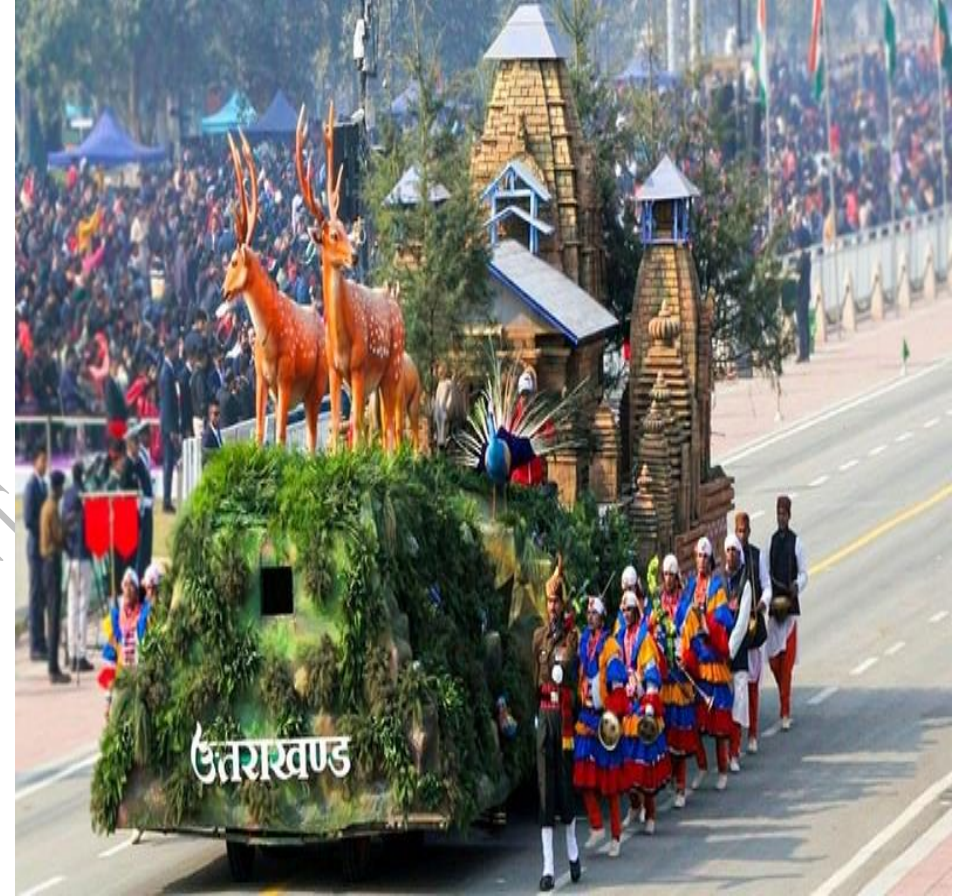
वर्ष 2023 में गणतंत्र दिवस परेड में पाया पहला स्थान—मानसखण्ड झांकी, उत्तराखण्ड