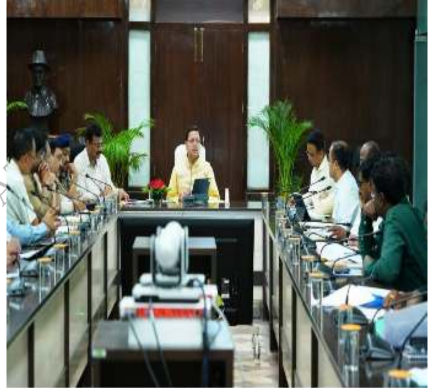
सचिवालय में सीएम हेल्लोइन-1925 की समीक्षा करते हुये मुख्यमंत्री श्री पृथ्वर सिंह धामी। दिनांक 27 जुलाई, 2023