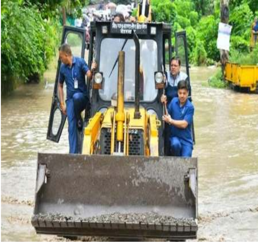
उत्तराखण्ड में बादल फटने के कारण आई बाढ़ का दौरा करते मा0 मुख्यमंत्री, उत्तराखण्ड