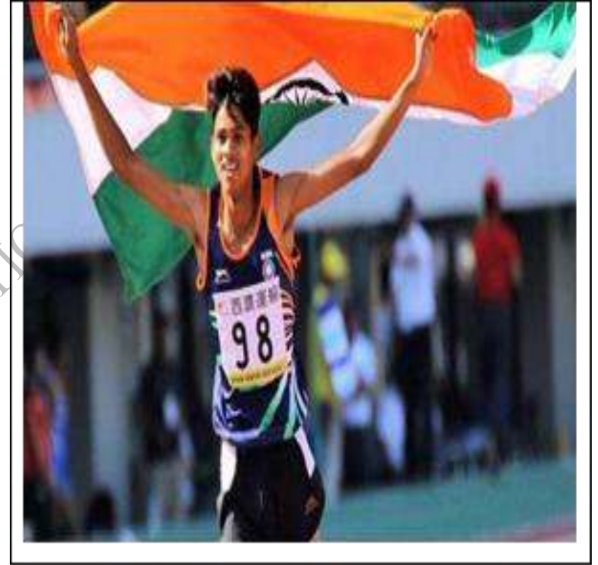
एशियन जूनियर एथलेटिक्स चैम्पियनशिप, 2018