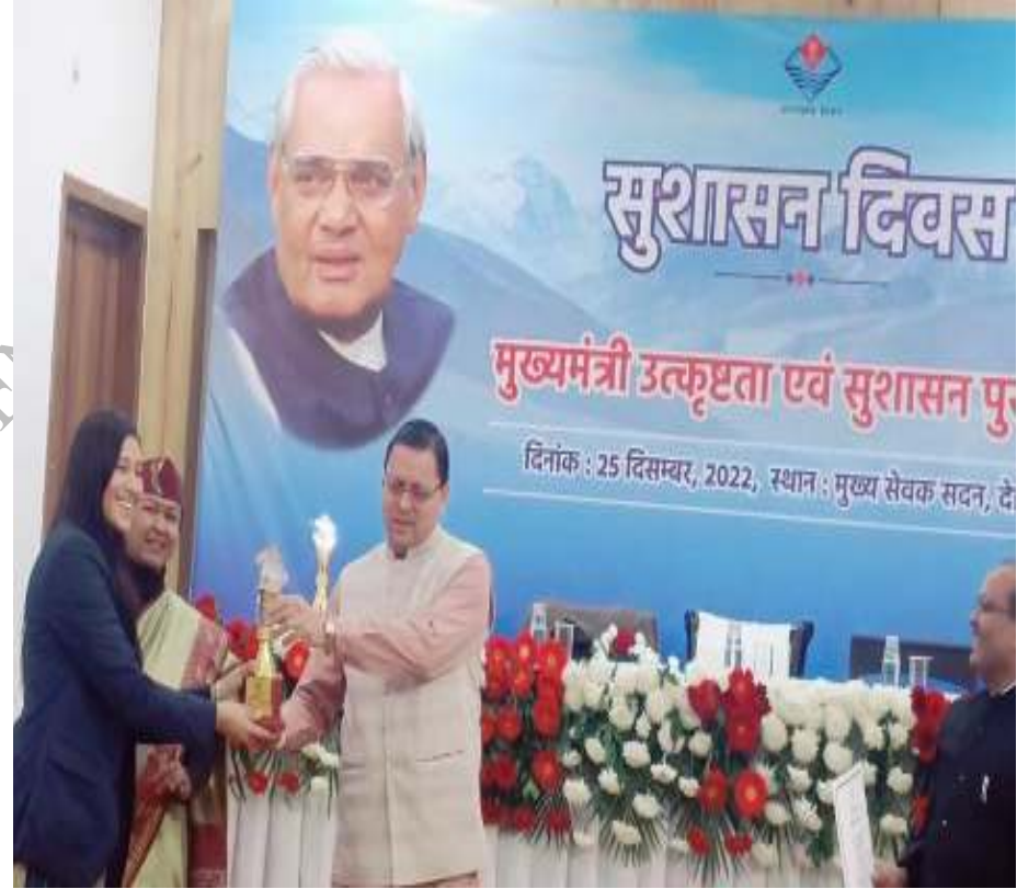
मुख्यमंत्री उत्कृष्टता एवं सुशासन पुरस्कार वितरण समारोह वर्ष 2022